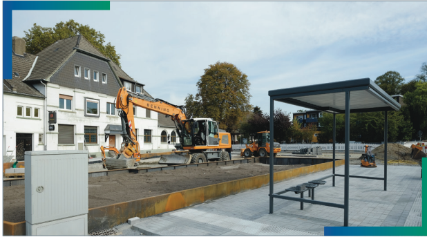
2018: Baustelle am Marktplatz Hassel