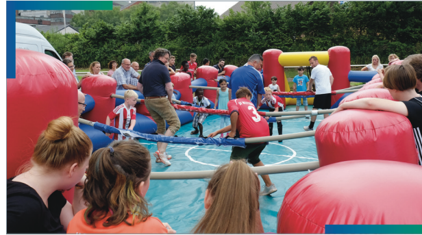
2017: Familienfest in Westerholt

Bringen Sie Ihre persönlichen Interessen, Ihre Ideen und Ihre Projekte mit ein! Im Torhaus 10 der Neuen Zeche Westerholt, in der Egonstraße, ist ein Stadtteilbüro eingerichtet worden: Hier können Sie sich über den Stand der Dinge informieren und mit Fachleuten diskutieren.