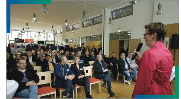
2017: Eigentümergebiet im Bonn